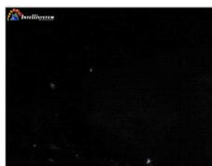
Con illuminatore IR spento