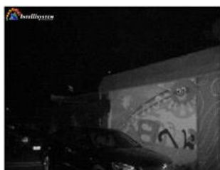
Con illuminatore IR acceso