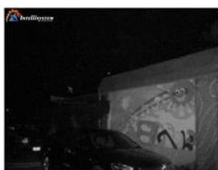
Con illuminatore IR acceso