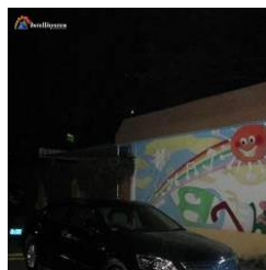
Con illuminatore acceso