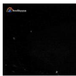
Con illuminatore spento