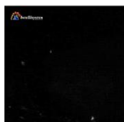
Con illuminatore spento