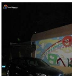
Con illuminatore acceso