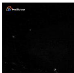
Con illuminatore spento