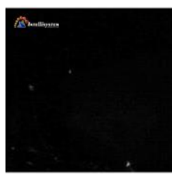
Con illuminatore spento