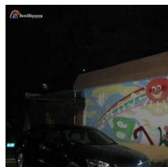
Con illuminatore acceso