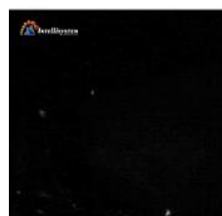
Con illuminatore spento