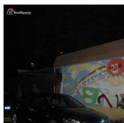
Con illuminatore acceso