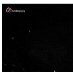
Con illuminatore spento