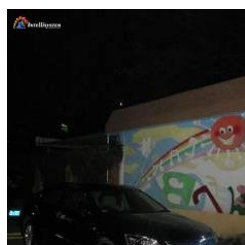
Con illuminatore acceso